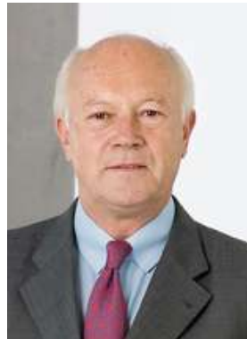
Hans-Peter Uhl Vorsitzender der Arbeitsgruppe Innen

Mit dem in zweiter und dritter Lesung zur Verabschiedung anstehenden Gesetz zur Fortentwicklung der parlamentarischen Kontrolle der Nachrichtendienste des Bundes werden wir das gegenwärtige System der Parlamentskontrolle im sensiblen Bereich der Geheimdienste insgesamt effektiver gestalten. Dies geschieht durch Verbesserung der Informations- und Handlungsmöglichkeiten sowie der Arbeitsfähigkeit des Parlamentarischen Kontrollgremiums (PKGr). Dabei haben wir besonderen Wert darauf gelegt, dass der notwendige Geheimschutz nicht aufgegeben wird, um die Funktions- und Kooperationsfähigkeit der Dienste nicht zu gefährden. Denn die Dienste leisten einen unverzichtbaren Beitrag zur Wahrung unserer freiheitlich-demokratischen Grundordnung. Das Gesetz wird flankiert durch eine Änderung des Grundgesetzes. Im neuen Artikel 45d Grundgesetz wird das Parlamentarische Kontrollgremium nunmehr ausdrücklich in der Verfassung verankert, um der herausragenden Bedeutung der parlamentarischen Kontrolle nachrichtendienstlicher Tätigkeit Rechnung zu tragen.