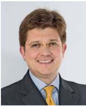
Eckart von Klaeden Vorsitzender der Arbeitsgruppe Auswärtiges