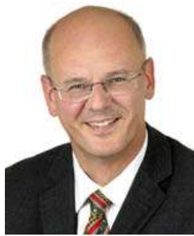
Siegfried Kauder Mitglied des Rechtsausschusses

Die Große Koalition hat mit den heute verabschiedeten fünf Strafrechtsgesetzen erneut Handlungsfähigkeit im Bereich der Rechtspolitik bewiesen. Mit den neuen gesetzlichen Regelungen im Bereich der Terrorismusbekämpfung, einer neuen Kronzeugenregelung, der Regelung von Absprachen im Strafprozess, dem neuen Untersuchungshaftrecht und einer Verbesserung der Haftentschädigung für Justizopfer werden in verschiedenen Bereichen entscheidende Verbesserungen herbeigeführt.