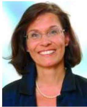
Antje Tillmann Vorsitzende der Arbeitsgruppe Föderalismuskommission

Das derzeitige Ausmaß der Verschuldung - auch ohne die aktuellen Schulden aus der Wirtschaftskrise - sind eine schwere Last für die künftigen Generationen. Art. 115 des Grundgesetzes, der eine Kreditaufnahme für Investitionen und zur Abwehr einer Störung des gesamtwirtschaftlichen Gleichgewichts vorsieht, hat bisher nicht die erforderlichen Grenzen gesetzt. Denn es wurden nicht nur Schulden aufgenommen, die einen gleichen Gegenwert in Investitionen hatten, wie es die Verfassung eigentlich gewollt hat.