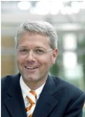
Norbert Röttgen Erster Parlamentarischer Geschäftsführer