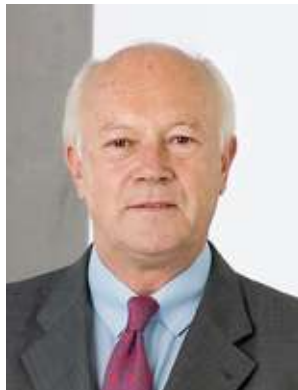
Hans-Peter Uhl Vorsitzender der Arbeitsgruppe Innen