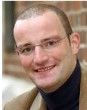
Jens Spahn Stellvertretender Vorsitzender der Arbeitsgruppe Gesundheit