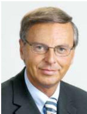
Wolfgang Bosbach Stellvertretender Fraktionsvorsitzender